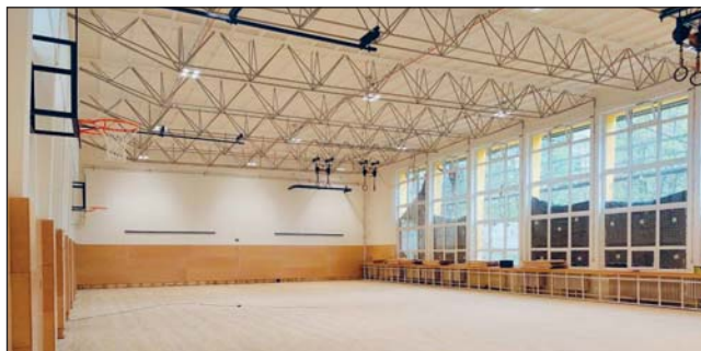
GENERÁLNÍ REKONSTRUKCE tělocvičny ZŠ Gen. Janka se blíží do finále. Opravy financované z rozpočtu obvodu, města a z dotací probíhají podle plánu a tělocvična bude brzo k dispozici dětem.